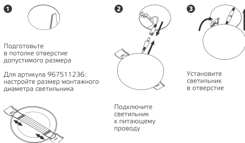
Рис. 2. Порядок монтажа